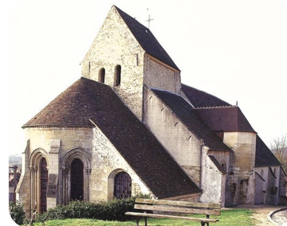
Eglise Saint-Pierre-es-Liens de Vaux sur Seine modifiée au cours des âges depuis le XIIème siècle

Site internet : http://avrilvaux.wix.com/association